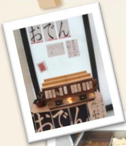
おでんバイキング