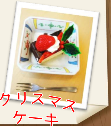
クリスマス ケーキ