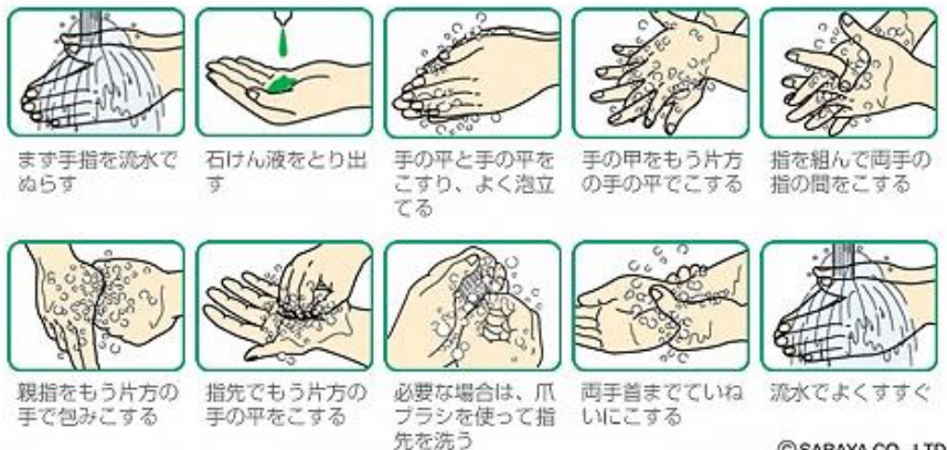
正しい手洗いの方法の図